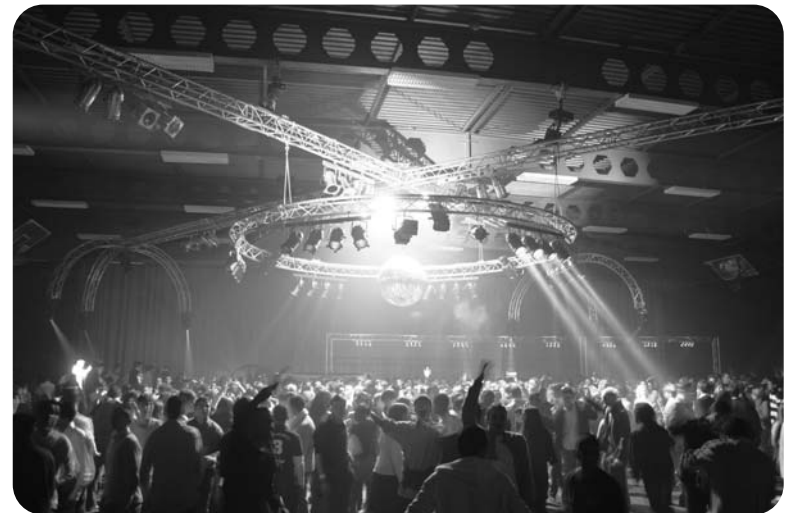
La "W Night" sera l'occasion de faire la fête en toute sécurité, dans un lieu complètement transformé pour la Saint-Sylvestre.

Un arrêt Noctambus est aussi prévu à 250 mètres de la soirée et des affiches "Bob" seront disséminées un peu partout. Enfin, des éthylo-testes seront distribués.