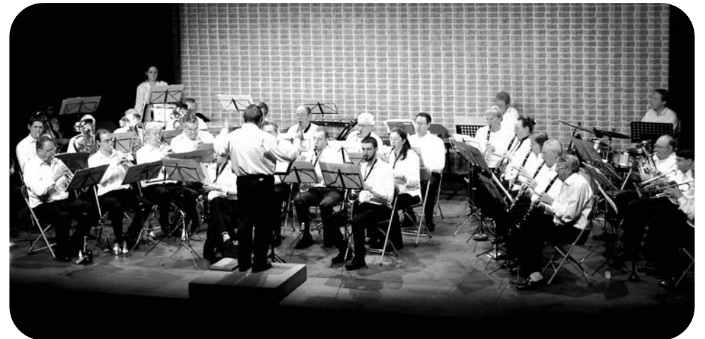
Entièrement gratuit, ce concert fait partie des traditions waterlootoises.

Mais c'est un tout autre programme qui sera proposé ce dimanche 17 décembre. Des œuvres de Glenn Miller, Duke Ellington, Cole