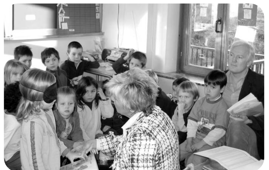
Ce livre pédagogique est prévu pour passer dans toutes les petites mains. Plastifié et de grande taille, il est solide et lavable.

Dans une classe d'enfants voyants, le livre permet aussi de développer le lien entre sens tactile et visuel, la connaissance de l'abstraction ainsi que l'apprentissage de l'alphabet.