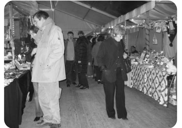
Les visiteurs aiment généralement déambuler entre les échoppes artisanales.