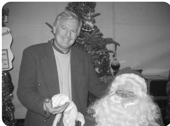
L'échevin du Commerce a demandé au père Noël de venir distribuer quelques friandises.