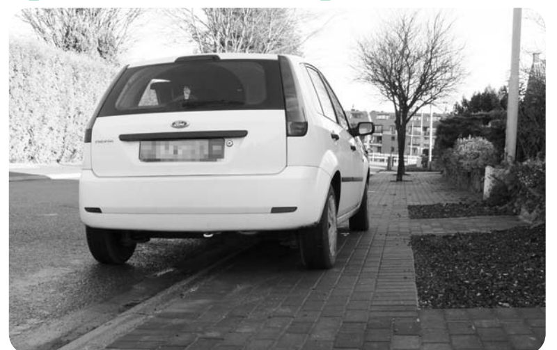
L'utilisation des trottoirs comme parkings est inacceptable. En plus de les endommager, ce comportement nuit à la sécurité des usagers faibles.

Certains n'hésitent pourtant pas à encore utiliser ces trottoirs comme parkings. C'est désormais la répression qui est donc de mise. Avec, à la clef, des amendes pouvant monter jusqu'à 100 €.